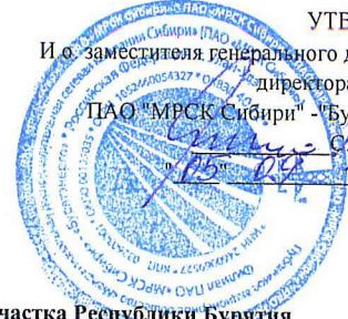
ГРАФИК временного отключения потребления на 2018/2019гг.

УТВЕРЖДАЮ И.о. заместителя генерального директора - директора филиала ПАО "МРСК Сибири" - "Бурятэнерго" С.Ю. Козлов 2018 г.